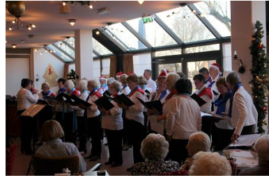
AAtrium "tussen de oliebollen"