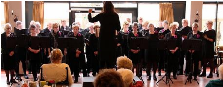
zondagmiddag 19-01-2020 het Atrium