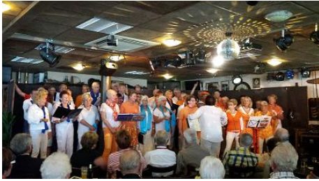
Café d'n Brouwer