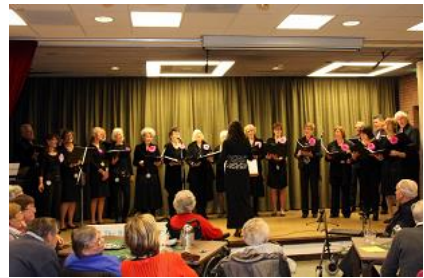
Joachim & Anna